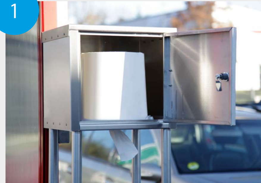
Die Desinfektionstücher sind schnell ausgetauscht.