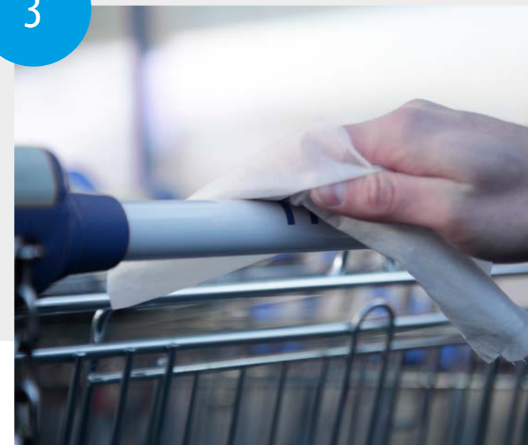
Einfach über den Griff wischen - fertig.